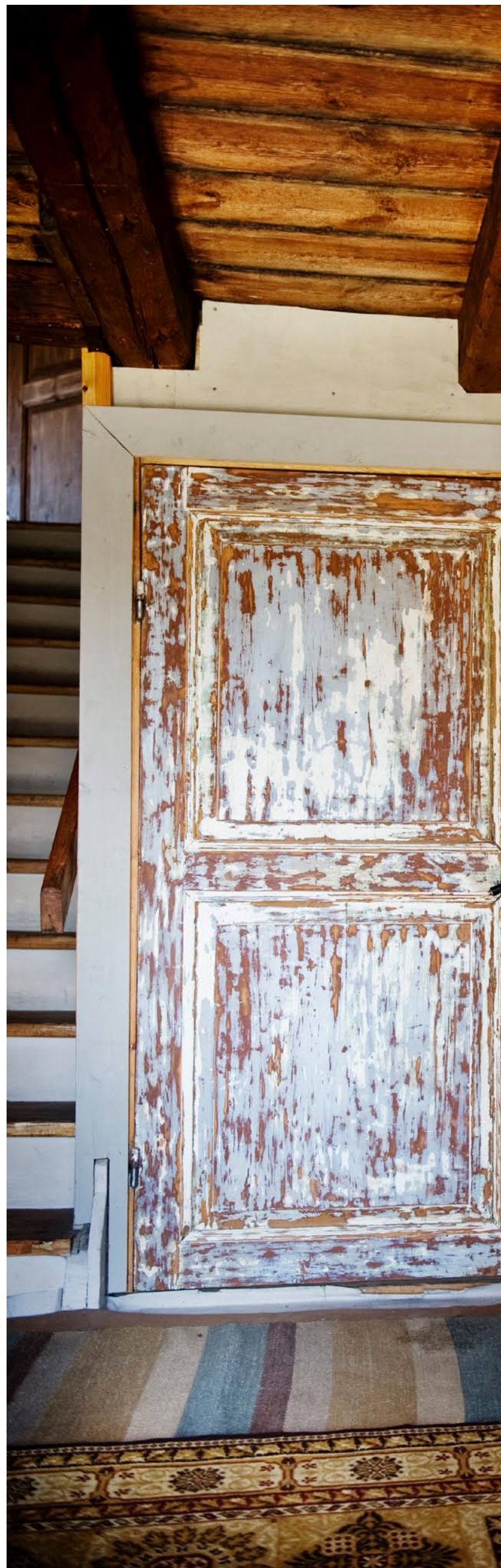
I entrén möts besökaren av två gamla dörrar som anger tonen i detta hus Chris affär.

Information om lerhus: www.svenskajordhus.se .